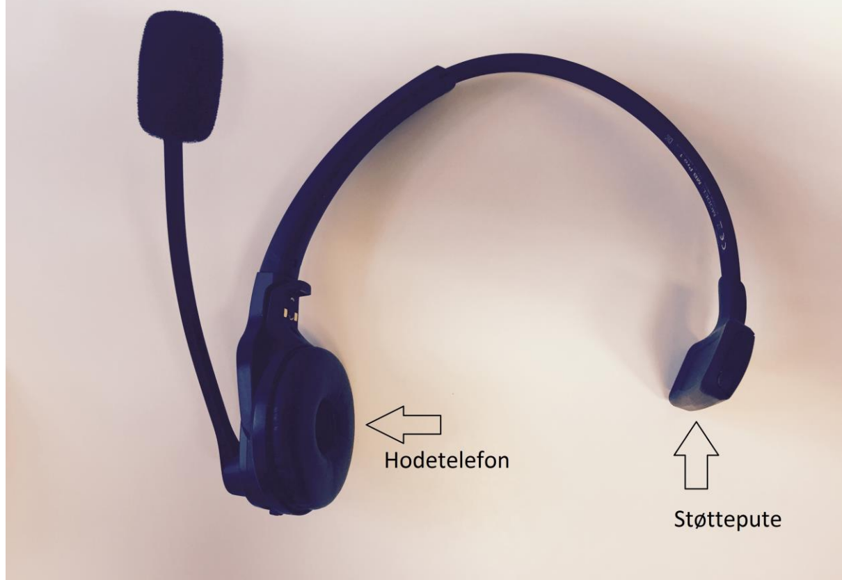
Sennheiser MB Pro 1